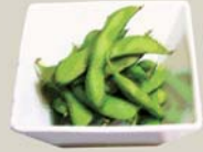
枝豆 "Edamame" Boiled Japanese green soybeans