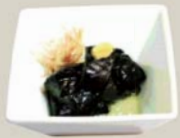
茄子の揚げ浸し "Agebitashi" Quick-fried eggplants with hot broth