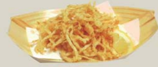
サキイカの天ぷら "Sakiika" Tempura Fried squid strip