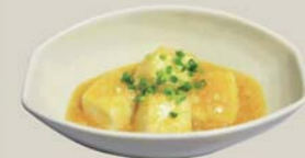
揚げ出し豆腐の蟹あんかけ "Agedashi-Tofu" Quick-fried TOFU with crab thick sauce on top

お好みで盛り合わせも承ります。詳しくはスタッフまでお尋ねください。 For Assorted platter of your choice, please ask your server.