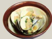
ハマグリの ガーリック醤油漬け "Hamaguri" Clam with garlic soy sauce