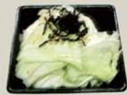
キャベツ "Cabbage" 塩昆布と太白胡麻油和え Kombu Seaweed on top