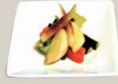
権ハピクルス "Pickles" Japanese Ginger, Celery, Carrots