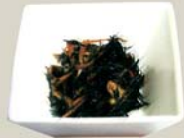
五目ひじき "Hijiki" Simmered hijiki seaweeds