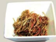
キンピラ "Kinpira" Burdock root cooked in soy sauces