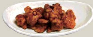
オレンジチキン 鶏の唐揚げ オレンジソース "Orange Chicken"