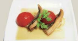
アジとトマトの 南蛮漬け "Escabeche" Quick-fried horse mackerel & tomato