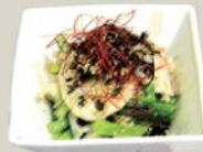
権ハナムル "Namuru" Komatsuna and lotus root dressed with sesame oil