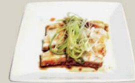
ゆで豚の冷製四川風 "Yude-Buta" Boiled pork with szechwan garlic sauce