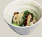
たこの梅肉和え "Bainiku ae" Octopus and okra with pickled plum